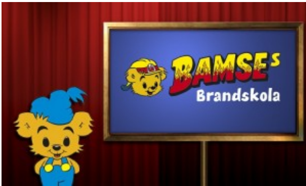
Figur 3. Bamses brandskola (återges med tillstånd).

Många klasser väljer att arbeta med tidningen i skolan.