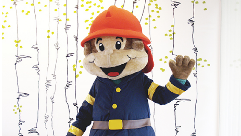
Figur 2. Flammyapan (återges med tillstånd). Källa: Brandskyddsföreningen.

Flammy har också en rekommendation om vad som är bra brandskydd: