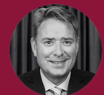
Generalsekreterare & vd Brandskyddsföreningen